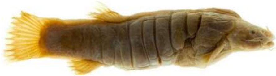
Imagen tomada de: El graso de Tota: único pez de agua dulce extinto en Colombia. Caracol Radio. 2021.

Disponible en: https://caracol.com.co/radio/2021/07/29/nacional/1627554240_513040.html